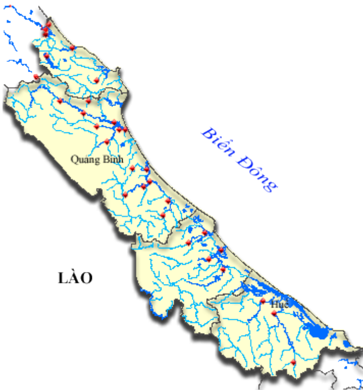
Hình 1.4 Bản đồ mạng lưới trạm thủy văn theo lưu vực sông