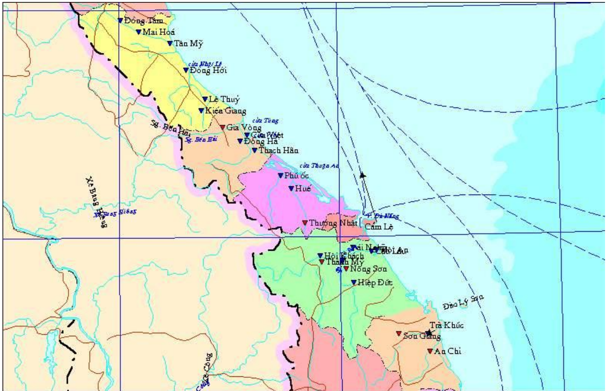
Hình 1.3: Bản đồ mạng lưới trạm thủy văn tỉnh Quảng Bình (màu vàng)